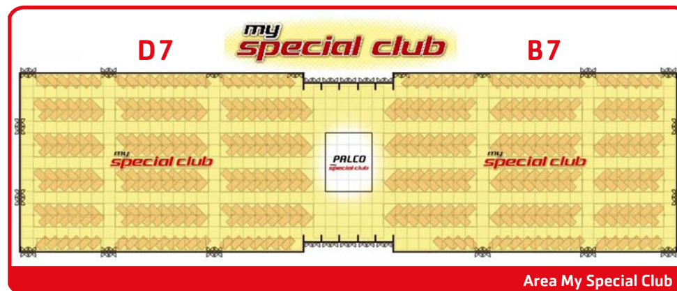
Area My Special Club